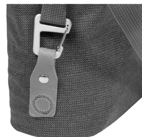
Detailansicht: Karabinerbefestigung für Tragegurt