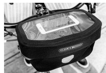
Smartphone im transparenten Deckelfach (nicht enthalten)