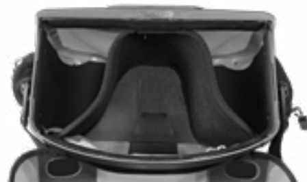
Innentaschenunterteilung Ultimate Six Internal Divider (separat erhältlich)