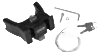
E207 Handlebar Mounting-Set E-Bike with Lock