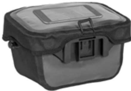
5 L Version: Smartphone im transparenten Deckelfach (nicht enthalten)