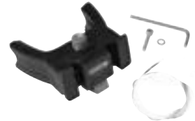
E226 Handlebar Mounting-Set E-Bike