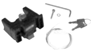
E185 Handlebar Mounting-Set with Lock