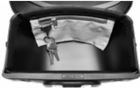
Karabiner mit Schlüsselbund