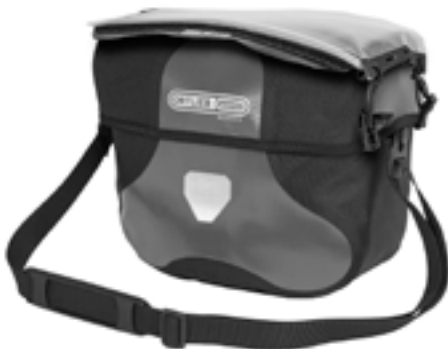
Befestigungsmöglichkeit für die Kartentasche Ultimate Six Map-Case (separat erhältlich)