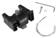
E225 Handlebar Mounting-Set