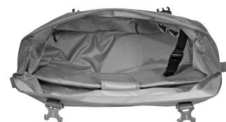
Innenansicht: gepolstertes Innenfach für Notebook