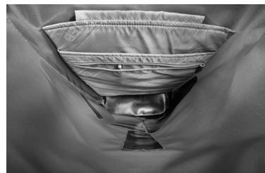
Innenansicht: gepolstertes Innenfach für Notebook