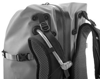
Wasserdichter Durchlass Trinkschlauch