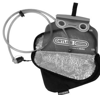
Hydration-System in Thermoisolationstasche