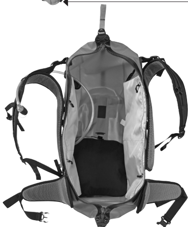
Anwendungsbeispiel: Hydration-System in Atrack